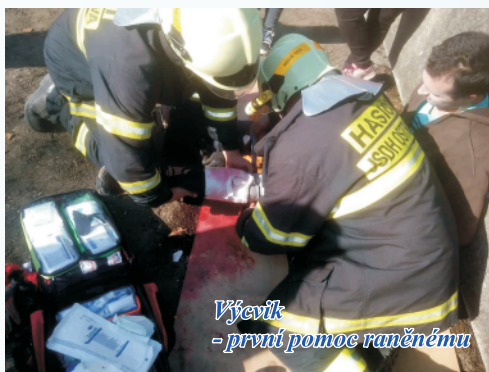
Výcvik - první pomoc raněnému