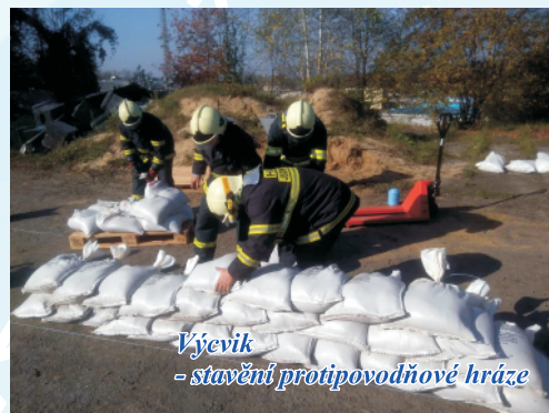
Výcvik - stavění protipovodňové hráze