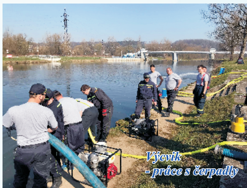
Výcvik - práce s čerpadly